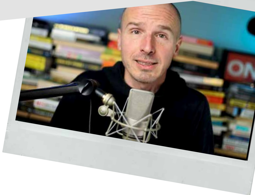
MARCO MONTEMAGNO 3.3 MLN FOLLOWER