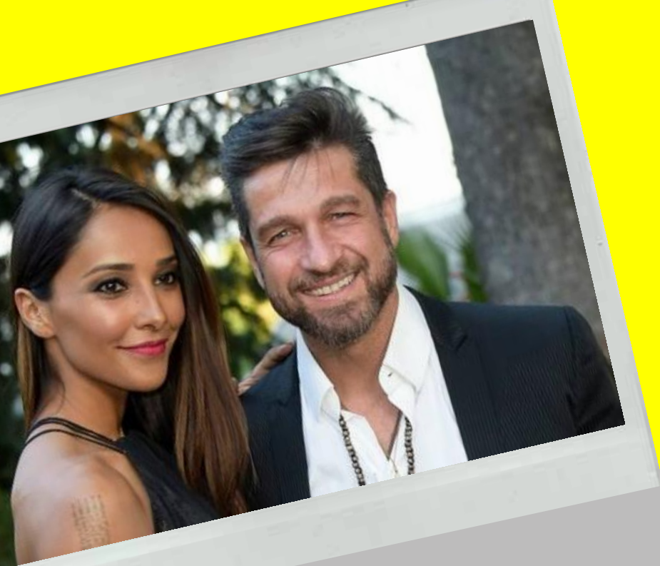
STOPPEIRAS 2.6 MLN FOLLOWER